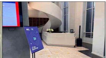
로비 리셉션 데스크(1F)