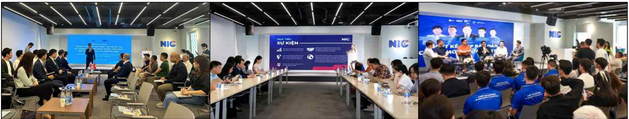
월간 라운드테이블 비즈매칭