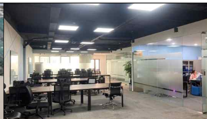
한국 IT스타트업 전용공간(5F)