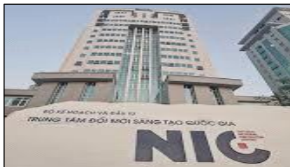
NIC 하노이 빌딩 전경